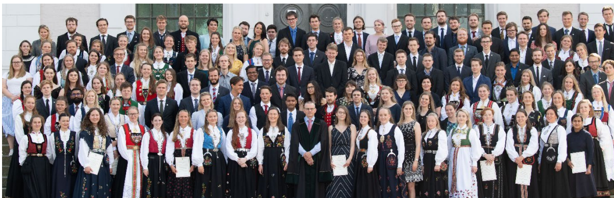
masterseremonien 2019

Kandidatproduksjon inngår som parameter i finansieringssystemet for høyere utdanning. Årstudiene gir ikke oppnådde grader, så her vil vi se på bachelor- og mastergradene.