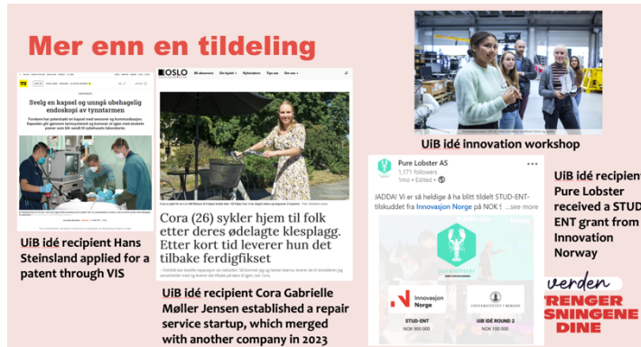
Figur 3 Eksempler på samspill mellom UiB idé-prosjekter og det øvrige virkemiddelapparatet. Figur: Yves Aubert, FIA.

e) Hvilken betydning har det hatt at vi har brukt en ekstern evalueringskomité?