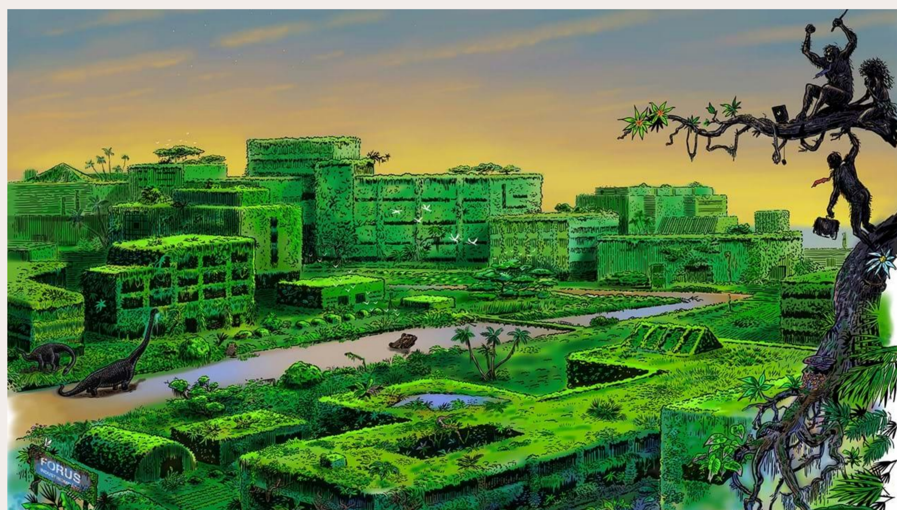
Illustrasjonsbilde Forusvisjonen, Forus hengende hager

Etter intervjuene er bearbeidet vil jeg fortsette med teori og dokumentanalyse.