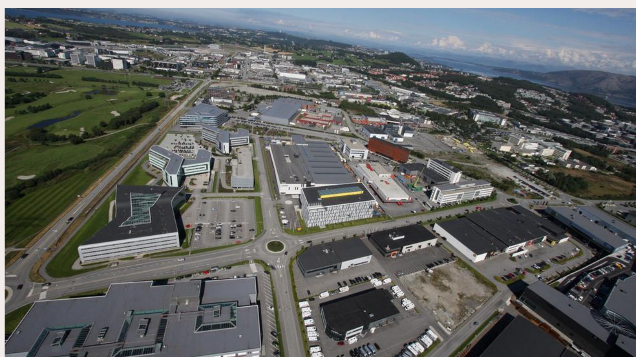
Forus næringsområde, 2019

Edvard Hviding Universitetet i Bergen Edvard.hviding@uib.no Veileder : Håvard Haarstad