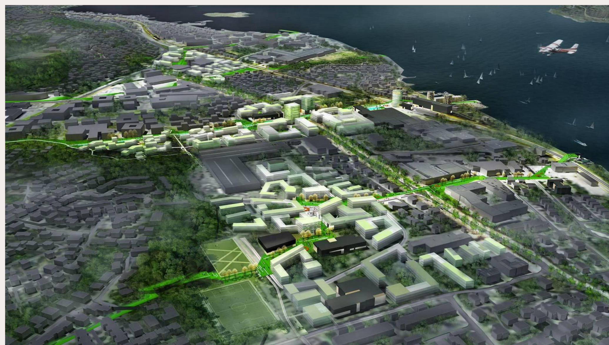
Illustrasjonsbilde for Fremtidens Forus, Forusvisjonen