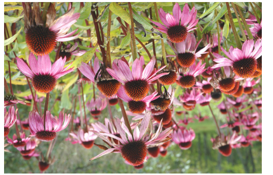
Purpursolhatt, en gammel medisinplante i Nyttvekst-hagen.

Naturskog Samlingene på Milde er mange steder integrert i naturlig skog. Nordre del av Arboretet er dekket av furuskog med rhododendron. Sumpskog med svartor finnes omkring Mørkevågen og ved Vågelva i Japanhagen. Varmekjær skog med eik og hassel opptre i Nausdalen og omkring Fana Folkhøgskule. Rhododendron i furuskogen!