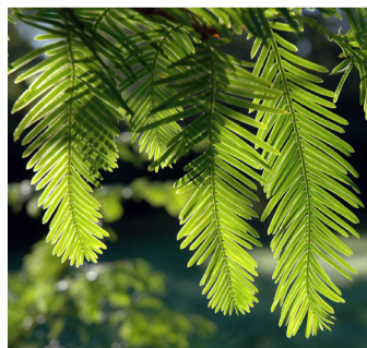
Urtidstreet - en levende fossil.