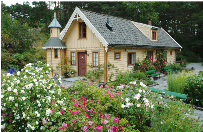
Sommer i hagen ved Blondehuset

Blondehuset ble bygget før 1850. Det stod opprinnelig ved Haukeland, men måtte rives da sykehuset skulle utvide i 1973. Huset ble gjenreist på Milde i 1992, og brukes i dag til kafé, møtelokale og utleie til arrangementer. I Blondehushagen stiller vi ut historiske hageplanter med tradisjoner fra Vestlandet.