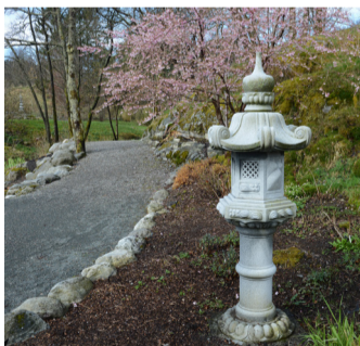
Kirsebærblomstring i Japanhagen.