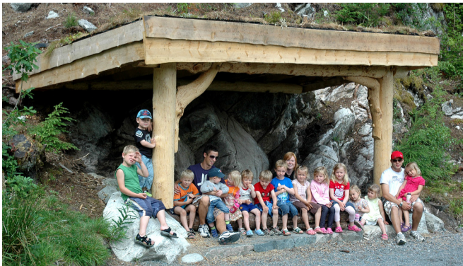
Barnehage på tur i Arboretet.

Arboretet og Botanisk hage er et populært friluftsområde med mange muligheter. Området kan brukes til aktiviteter i skogen, på stranden og ved ferskvann.