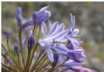
Agapanthus - Afrikas blå lilje.