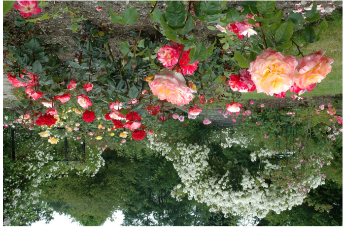
Rosarier innenfor portalen til de moderne rosene.

Lynghagen Lynghagen ble gitt i gave fra Arboretets venner til Det norske arborets 25-års jubileum i 1996. I hagen er det blomstring store deler av året. Først ute er vårlynghagen med kraftige rødfarger i mars-april. Mange sorter røsslynghage blomstrer lenge utover høsten. Rosarier Arboretet har Norges største rosesamling med mer enn 500 ulike arter og sorter. Samlingen ligger i Nausdalen og er delt mellom Villrosebakken, der rosene er ordnet etter slektskap, og Den historiske bakken, der hagerosens historie er tema. Selve Rosarier, som ble åpnet i 1985, inneholder de moderne hagerosene som egner seg best for Vestlandet.