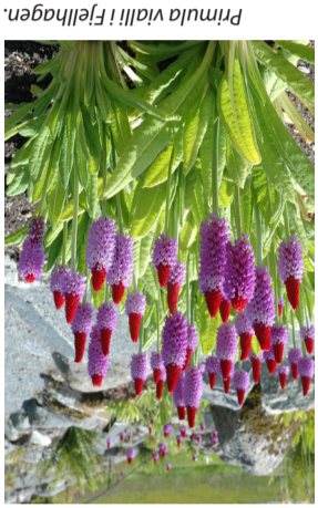
Primula vallii i Fjellhagen.

På Solbåken finnes en stor sommerblomstutstilling. Når peonene blomstrer i juni er Solbåken vel verdt et besøk. Planter fra oljetre- og kaprifolifamilien har også fått sin plass i området. Vannplanter og annet liv i ferskvann kan studeres fra bryggen i takarbeidet i Mildevatnet ("Fægris vannvisjon").