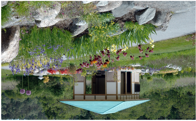
Fra Iris-samlingen i Fjellhagen sett mot Tepaviljongen i Japanhagen.

Japanhagen ble bygget i perioden 2005-08, og inneholder elementer fra japansk hagekunst, slik som broer, lykter, grushage, mosehage og tepaviljong. Mange planter med asiatiske opphav trives godt i norsk klima, og hagen har et stort utvalg av planter fra Japan. Hagen er tegnet av den anerkjente landskapsarkitekten Haruto Kobayashi.