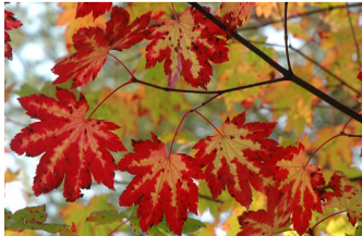
Japanlønn får fine høstfarger.