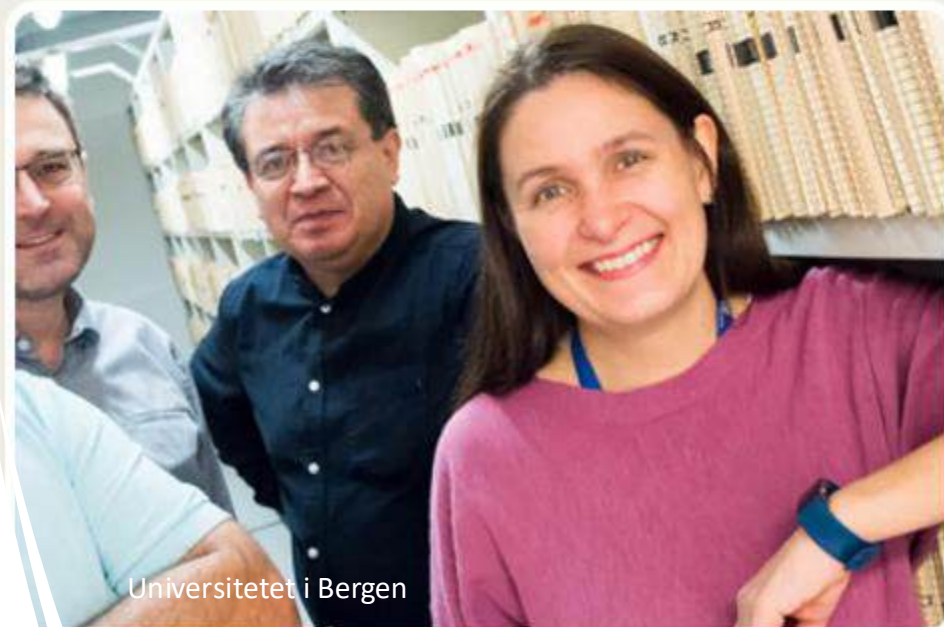
Universitetet i Bergen

Haukeland universitetssjukehus har samla hovudtyngda av dei kontorfaglege oppgåvene i Dokumentasjonsavdelinga i Møllendalsbakken 7. Her jobbar rundt 140 tilsette fordelt på fire seksjonar.