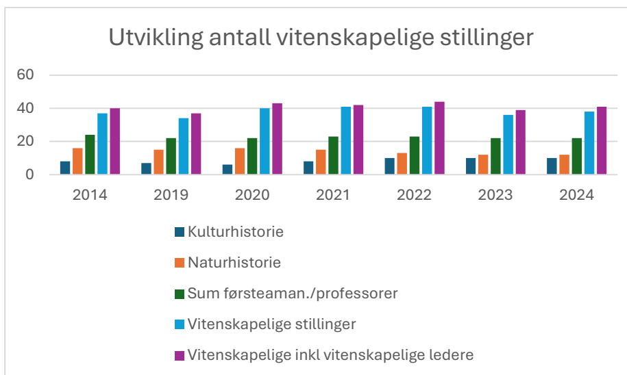
Figur 3 viser utvikling i antall vitenskapelige stillinger ved Universitetsmuseet. Sum vitenskapelige inkluderer rekrutteringsstillinger og forskerstillinger i tillegg til førsteamanuenser og professorer. Tall for 2014 viser bemanningsplan samt øremerkede stipendiatstillinger.