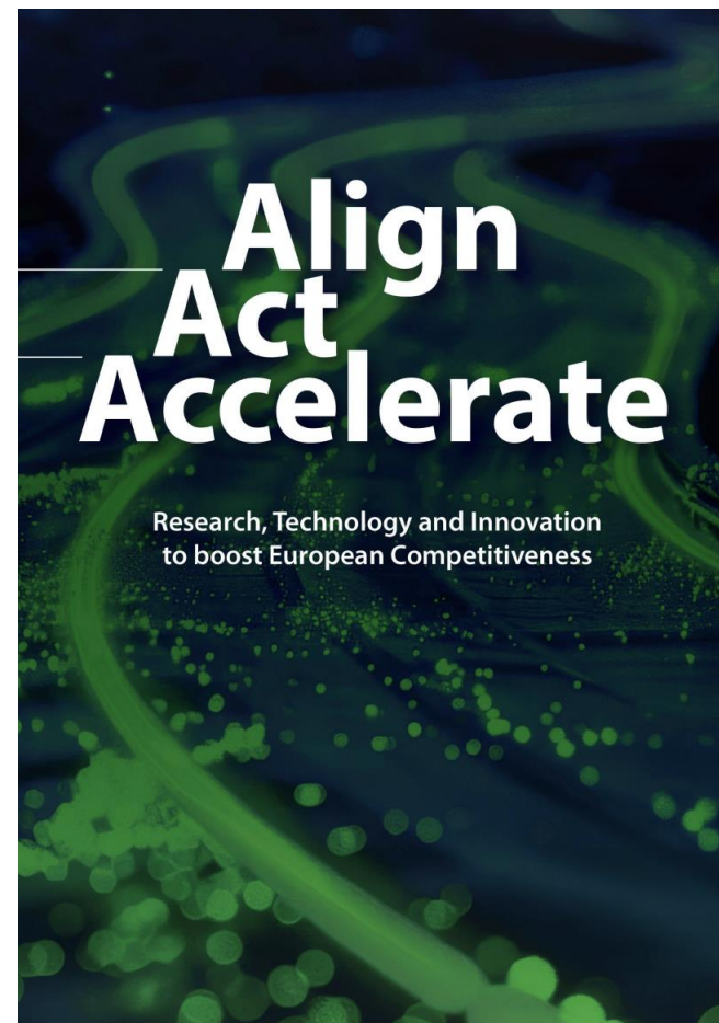
Heitor (High-level expert group)