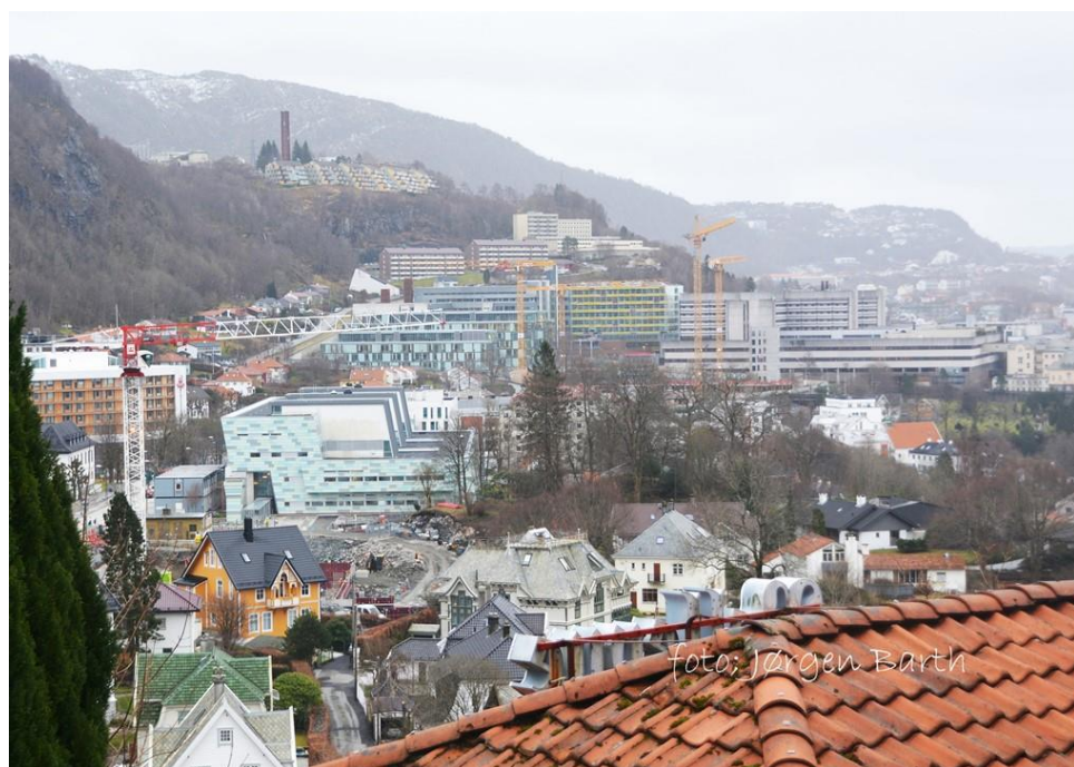
Gravingen i Årstadveien 17 for Alrek helseklynge, «Odontologen» og Haukeland sykehus sett fra Bellevue

Alle som har oblater for 2019 er allerede registrert hos EIA og dermed hvitelistet.