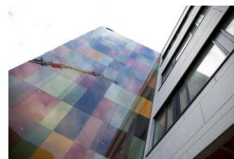
Glassveggen på Alrek-bygget fremstår forskjellig alt etter hvor solen står på himmelen.