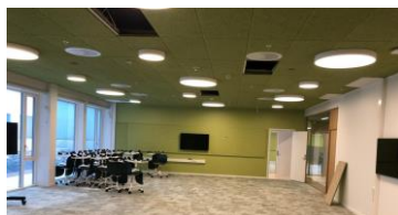
Et av rommene i Årstadveien 17.