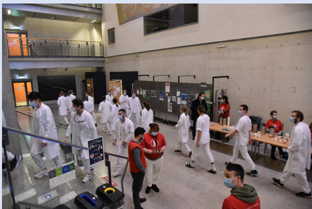
Studenter og personell er samlet i Vrimle forut for eksamen.

Vi håper så mange som mulig har anledning til å delta! Av erfaring vet vi at mange synes det er utrolig kjekt å få være med på OSKE. Det er en fin mulighet til å treffe kolleger du ikke ser hver dag, og få et innblikk i hvordan eksamen til studentene fungerer. I tillegg får dere servert lunsj og mulighet til å mingle i lunsjen.