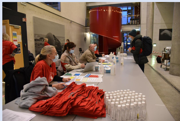
Registrering før eksamen.

Dersom dere har spørsmål, ikke nøl med å ta kontakt med oss