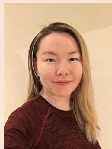
Anneli Skjold

Les mer om Anneli Skjold arbeid og disputas