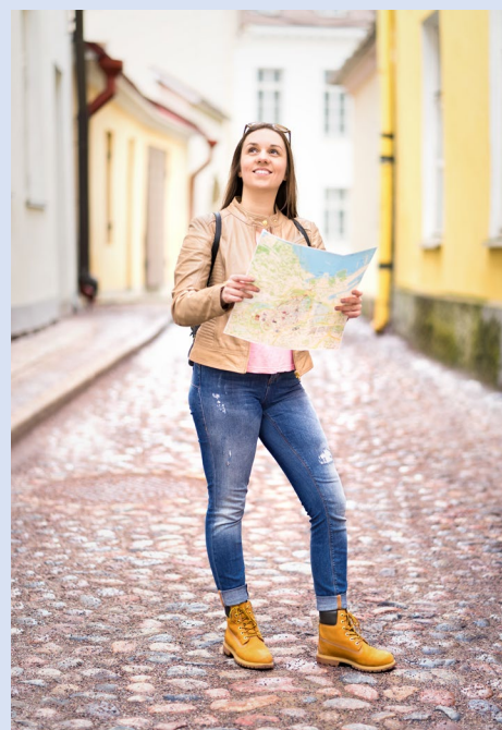
Utveksling