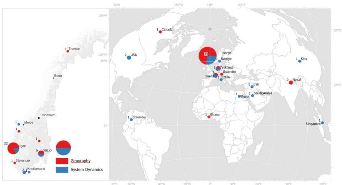
Map of workplace/country for PhD candidates from Department of Geography, UiB, within the disciplines Geography and System Dynamics. Numbers are total numbers per workplace/country, status august 2022. N=60

We would like to share some information about our PhD-program. This fall we have dived into some statistics and produced an Alumni-map. This includes aggregated information (status August 2022) and shows the locations of their workplaces.